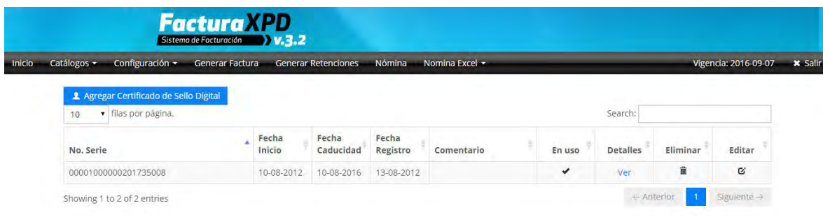
Imagen 4. Tabla de Certificados