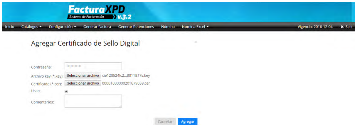
Imagen 2. Agregar archivos

NOTA: Es importante resaltar que después de haber generado los archivos de CSD, el SAT realiza una actualización de la lista de contribuyentes y los datos pueden tardar hasta 72hrs. en aparecer en esta lista y poder utilizar el CSD.