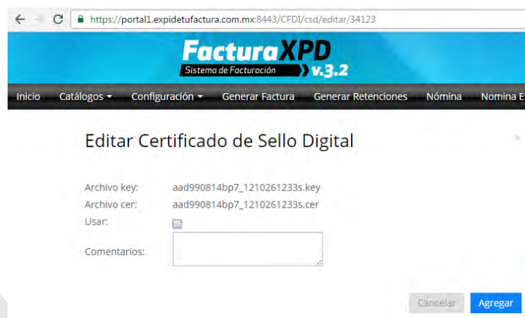
Imagen 3. Desactivar casilla "Usar"