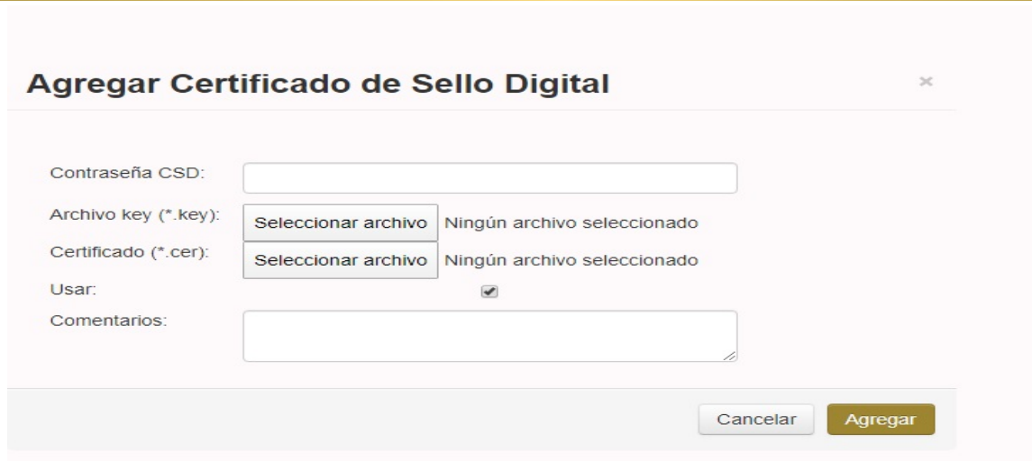
Imagen 2. Agregar archivos

NOTA: Es importante resaltar que después de haber generado los archivos de CSD, el SAT realiza una actualización de la lista de contribuyentes y los datos pueden tardar hasta 72hrs. en aparecer en esta lista y poder utilizar el CSD.