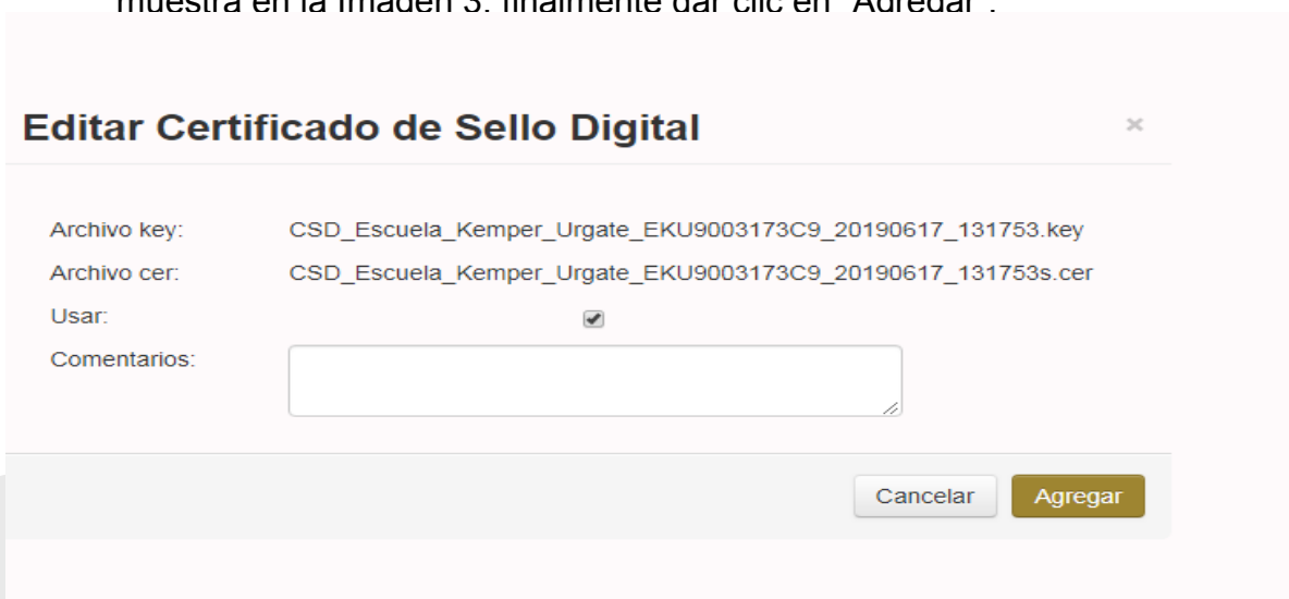
Imagen 3. Desactivar casilla “Usar”